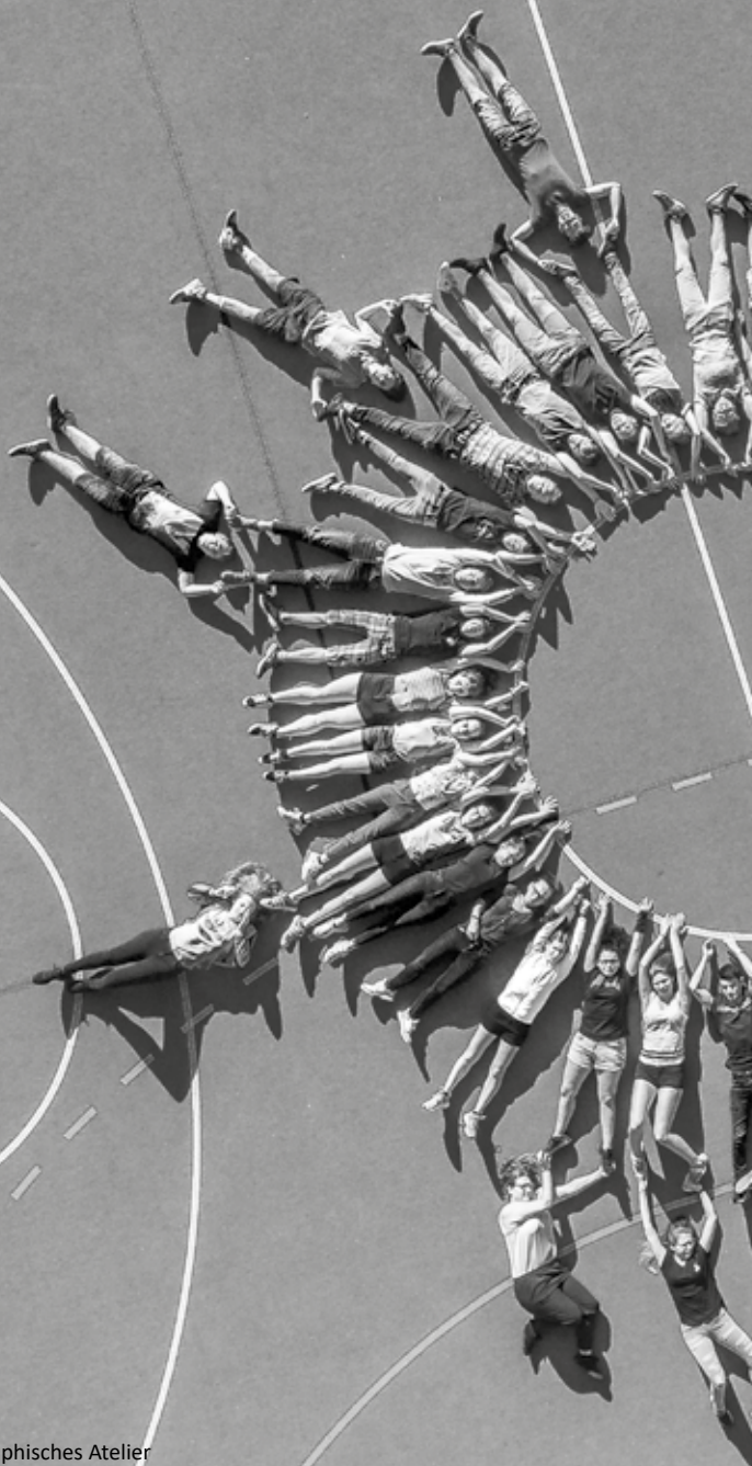
Titelbild : Gestaltung John Dierauer, Graphisches Atelier